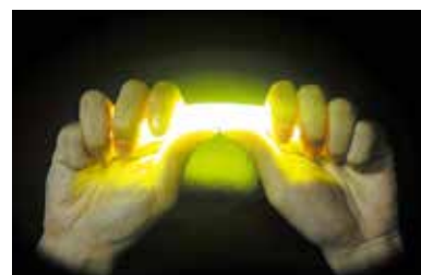
軽く曲げるだけで光り出します

ライトの構造が新しくなりました。旧仕様では折り曲げすぎると中に入っている液が漏れる恐れがありましたが、アーチ構造はわずかな折り曲げ角度で発光が可能となり、過度な曲げ方による液漏れのリスクが軽減されました。