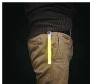
ベルトループに装着しマーカーとして