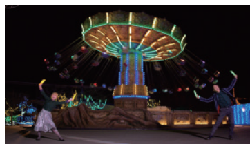
パオパオチャンネルver.