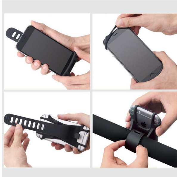
各種スマートフォンに適応